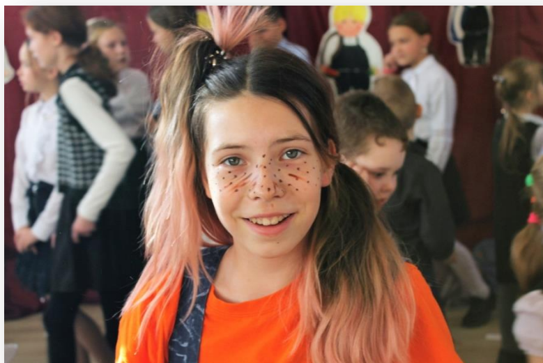
Первоклассники в восторге!

Главный герой Пеппилота, Харизма и любопытность!